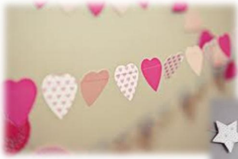
La guirlande en tissu